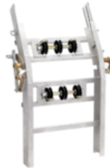
Tramo de 1 metro en ángulo operacional en ambos sentidos