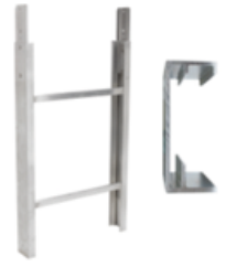
Tramo de escalera 1m 250kg