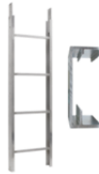
Tramo de escalera 2m 250kg