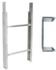
Tramo de escalera 1m 200kg