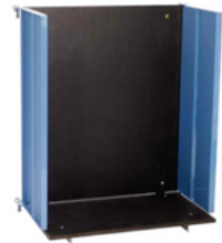
Plataforma de uso general