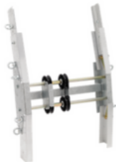
Tramo en ángulo corto