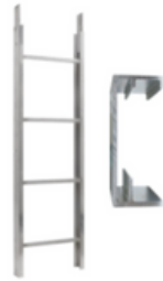
Tramo de escalera 2m 250kg