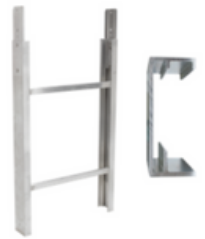
Tramo de escalera 1m 250kg