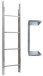
Tramo de escalera 2m 200kg