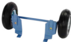
Eje con ruedas para el motor