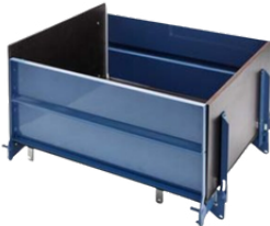
Plataforma VARIO con sistema de nivelación