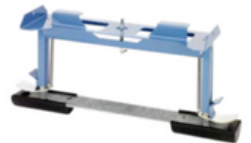
Apoyo de techo inclinado