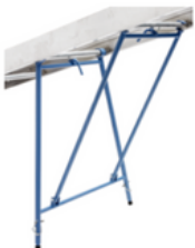
Apoyo para techos planos