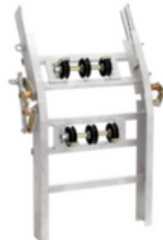
Tramo de 1 metro en ángulo operacional en ambos sentidos