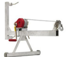
Brazo de montaje con cabestrante manual