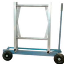
Base con ruedas para desplazamiento lateral